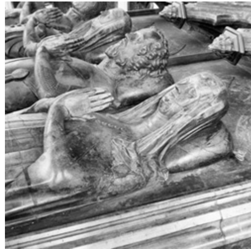
Afb. 8a en 8b. Zie MeMO memorial object ID 1437