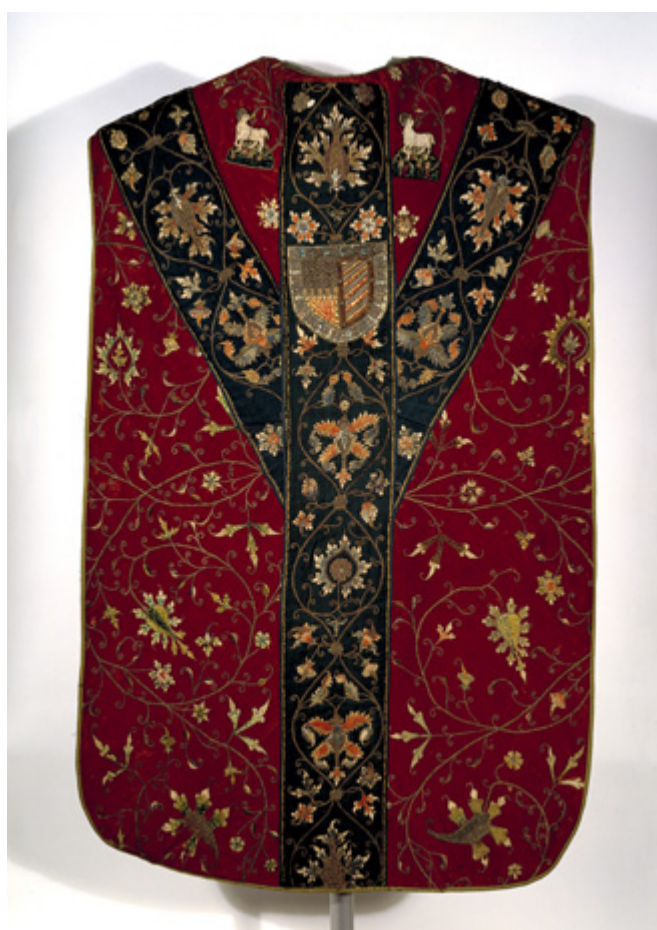
Afb. 4. Museum Catharijneconvent Utrecht, ABM t 2010a.

Opgenomen zijn grafmonumenten, grafzerken en memorievoorstellingen die (tenminste gedeeltelijk) nog bestaan en die afkomstig zijn uit middeleeuwse instellingen op het grondgebied van het huidige Nederland. Een aantal van de opgenomen objecten is niet heel precies te plaatsen omdat de instelling waarin zij oorspronkelijk een functie hadden niet bekend is. Als periodisering is het tijdvak tot 1580 gekozen. Rond 1580 werd vanwege de Reformatie het katholicisme in grote delen van het huidige Nederland als de publieke religie (tijdelijk) afgeschaft. Zowel grafmonumenten en grafzerken als memorievoorstellingen konden lang voor en lang na de dood van een of meer van de op het object herdachte personen worden geplaatst. Daarom is bij de datering steeds de datering nader verantwoord. Een datum van overlijden geeft dus alleen een indicatie voor nader onderzoek.