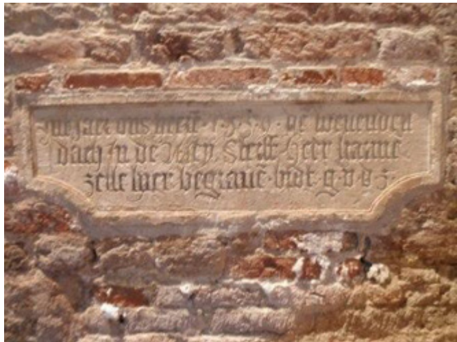
Boven: Afb. 9. Zie MeMO memorial object ID 2941 Onder: Afb. 10. Zie MeMO memorial object ID 1841

De gevolgen zijn groot. Grote aantallen beeldhouwde memorievoorstellingen hebben een totaal ander aanzien gekregen omdat de beschildering (polychromie) verloren is gegaan. Soms zijn nog wat verfstreken zichtbaar. Ook grafmonumenten en grafzerken, en de messing platen waarmee deze waren bedekt, konden deels van kleuren zijn voorzien. Dit geldt met name voor de grafbeelden en de wapenschilden. Hiervoor werden verf, gekleurd mastiek, ingelegde steen (bijvoorbeeld marmer of albast), email en (half)edelstenen gebruikt. Van wapenschilden zou men verwachten dat ze altijd beschilderd zouden zijn, maar of dit steeds zo was, is niet duidelijk. In een aantal gevallen zijn op de objecten de sporen van verf of andere kleurige versieringen nog zichtbaar, zie afb. 9 .