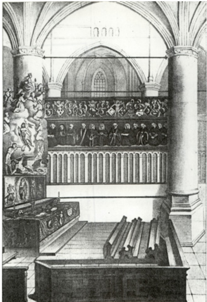
Afb. 11. Tekening uit 1620 van de Van Beverenkapel in de Grote of Onze Lieve Vrouwekerk in Dordrecht.

Voortschrijdende inzichten hebben eveneens geleid tot het maken van voorbehoud. Zo is bij het benoemen van steensoorten terughoudendheid betracht. De steensoort kan vaak alleen na uitgebreid onderzoek ter plaatse door deskundigen worden vastgesteld.