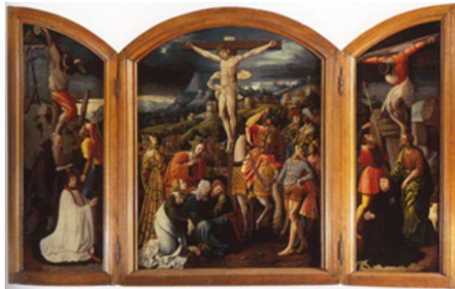
Afb. 1. Zie MeMO memorial object ID 628 en ID 492

Toen Christus stierf aan het Kruis werd het hemels paradijs weer toegankelijk voor de mensheid, zo leert het christendom ( afb.1 ). De zondeval van Adam en Eva was immers met Christus' dood tenietgedaan. De eerste christenen meenden dat het Laatste Oordeel niet lang op zich zou laten wachten. Leven als een goed christen was voldoende om in de hemel te komen. Toen dat Oordeel steeds maar uitbleef, ging men zich noodgedwongen afvragen wat er met de zielen van de overledenen gebeurde tot het moment van het Laatste Oordeel.