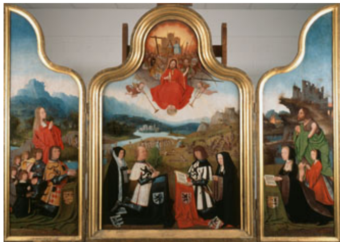
Boven: Afb. 9. Zie MeMO memorial object ID 1385 Onder: Afb. 10. Zie MeMO memorial object ID 718