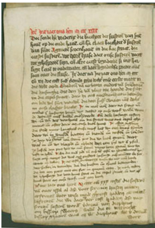
Afb. 6. Zie MeMO text carrier ID 106 en Commemoration in the convent Mariënpoel: prayer and politics

Objecten en handschriften die een rol speelden binnen de dodengedachtenis zijn allemaal te beschouwen als gebruiksvoorwerpen. Verhalende bronnen konden bijvoorbeeld worden voorgelezen ter educatie en tot gedachtenis. Kalenders waarin de te verrichten memoriendiensten waren aangetekend, dienden om instellingen te herinneren aan de verplichtingen die men had jegens hun weldoeners en wanneer de diensten moesten plaatsvinden (afb. 7). Memorievoorstellingen en grafzerken waren onder andere bedoeld om de gelovigen op te roepen tot gebed voor de overledenen.