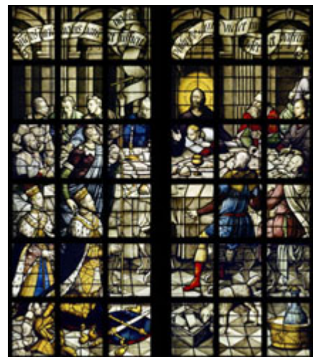
Links: Afb. 7. Zie MeMO text carrier ID 423 Rechts: Afb. 8. Zie MeMO memorial object ID 872