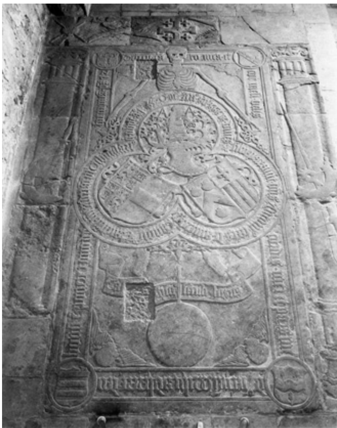
Afb. 5a en 5b. Zie MeMO memorial object ID 716 en MeMO memorial object ID 78